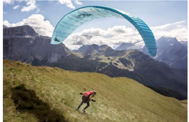
© Trentino Marketing, Daniele Lira, Val di Fassa

Trento, 9. August 2017. Das Trentino bietet ideale Bedingungen für Extremsportler und Adrenalin-Junkies: Ob beim Rafting, Paragliding, Klettern oder Mountainbiking – Abenteuerlustige kommen in der beeindruckenden Landschaft der norditalienischen Provinz ganzjährig auf ihre Kosten. Auf der vier- bis sechs-tägigen Reise „Let’s Dolomites – Adrenalin Pur“ gehen Urlauber mit erfahrenen Bergführern auf begleitete Touren.