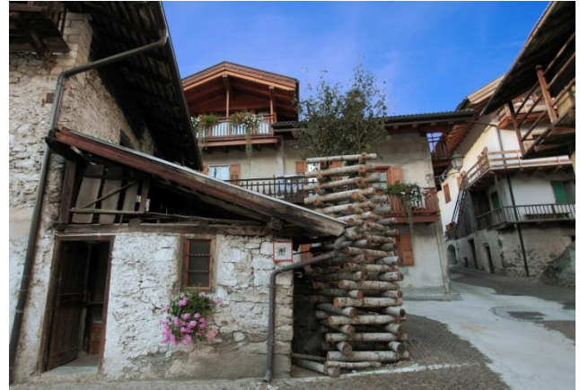
© Trentino Marketing, Luigi Valline, Mezzano

Trento, 30. August 2017. Das Jahr 2017 steht ganz im Zeichen der italienischen Dörfer. Um den nachhaltigen Tourismus in ländlichen Regionen und die schönsten noch unbekanntesten Ecken des Landes zu fördern setzt das „Anno dei Borghi“ einen wichtigen Fokus. Im Trentino können Touristen fünf der schönsten Ortschaften Italiens erkunden: Canale di Tenno, Rango und San Lorenzo in Banale, Mezzano sowie Vigo di Fassa.