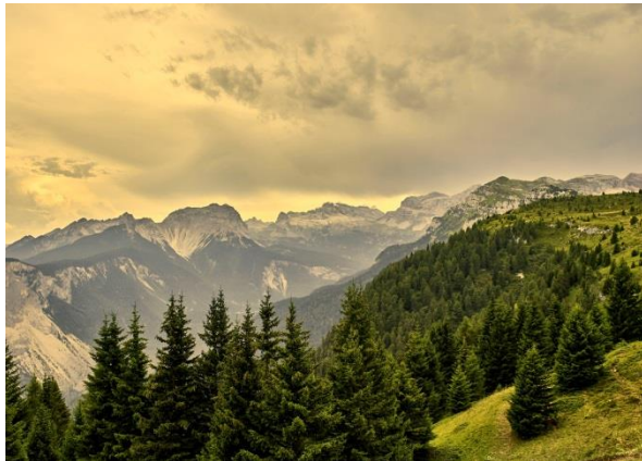
© Carlo Baroni – Val di Non