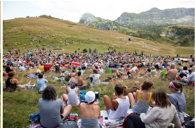
© Marisa Montibeller – Sounds of the Dolomites

Trento, 27. Juni 2019. Das Highlight des diesjährigen Sounds of the Dolomites Musikfestivals ist die Rossini Oper: Zum 25. Jubiläum wird die Oper am 31. August in der Hochebene Pian della Nana aufgeführt. Das Ensemble Musica a Palazzo, ein im Jahr 2005 gegründeter Kulturverein, möchte die traditionelle italienische Oper und die dazugehörige Kultur allen Generationen näherbringen. Das Musikfestival in den Dolomiten bietet dazu die ideale Gelegenheit, denn hier erleben Besucher die Musik hautnah und in einzigartiger Atmosphäre. Die Kulisse unter freiem Himmel und in 2.000 Metern Höhe verleiht der Musik des Ensembles einen ganz besonderen Vibe.