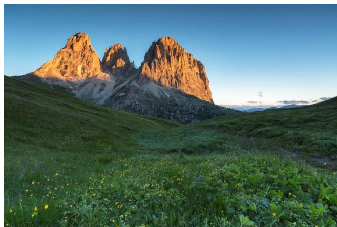
© Trentino Marketing_Alessandro Gruzza_Sassolungo Val di Fassa

Trento, 31. Juli 2018. Ganz Europa stöhnt unter der Hitze. Ganz Europa? Nein, in den Bergen des Trentino herrschen angenehmere Temperaturen. Hier finden hitzegeplagte Besucher erfrischende Urlaubsangebote von klaren Bergseen über Wassersportaktivitäten bis zu Wanderungen in der kühlen Bergwelt der Region zwischen Dolomiten und Gardasee.