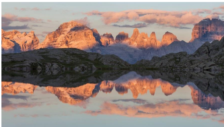
Le Dolomiti Unesco_Dolomiti di Brenta