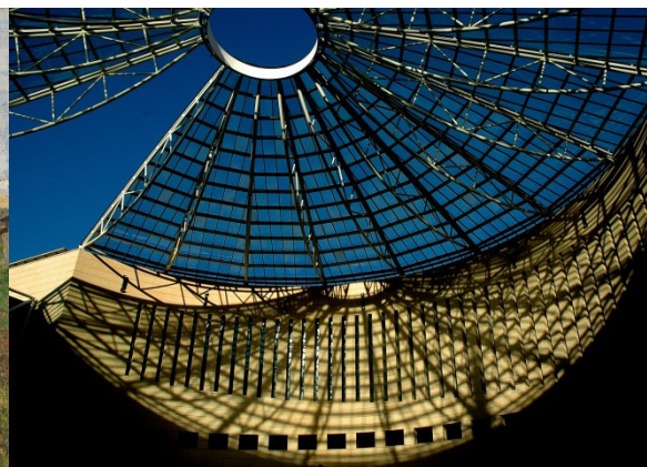
© Trentino Marketing_Daniele Lira Mart, Museo di Arte Moderna e Contemporanea di Trento e Rovereto

Trento, 19. April 2018. Die Landschaften Italiens, Sehnsuchtsorte der Europäer und Deutschen und Ziel der bekannten Grand Tour, der obligatorischen Reise junger Adeliger und wohlhabender Bürgersöhne, stehen im Mittelpunkt der Ausstellung im Mart in Rovereto: „Viaggio in Italia/Italian Journey – Landschaftsmalerei des 19. Jahrhunderts von den Macchiaioli zu den Symbolisten“.