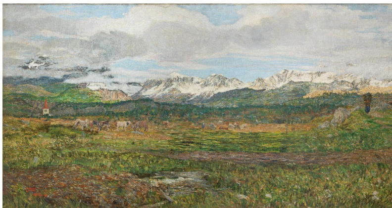
© Giovanni Segantini, Paesaggio sul Maloja, 1895_Galleria d'Arte Moderna, Milano

Das Mart in Rovereto zeigt italienische Landschaftsmalerei des 19. Jahrhunderts