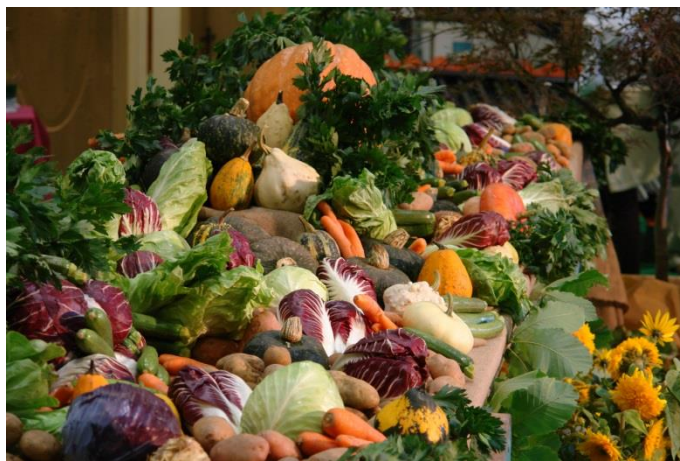
© Raccolti Mostra Mercato della Val di Gresta (c) Fototeca Visitovereto

Trento, 29. September 2018. Herbstzeit ist Genusszeit und von September bis Oktober geht es deshalb im Trentino kulinarisch hoch her: Weinlese, Apfelernte und viele Feste rund um regionale Köstlichkeiten. Los geht es mit dem „ DiVin Ottobre “, dem „göttlichen Oktober“, einer Veranstaltungsreihe der Initiative „ Straße des Weins und des Geschmacks “. Auf dem Programm stehen Wanderungen durch die Weinberge, Radtouren durch die herbstlichen Wälder und natürlich zahlreiche Gelegenheiten, um regionale Köstlichkeiten und lokale Weine zu probieren. Weitere Informationen unter www.tastetrentino.it .