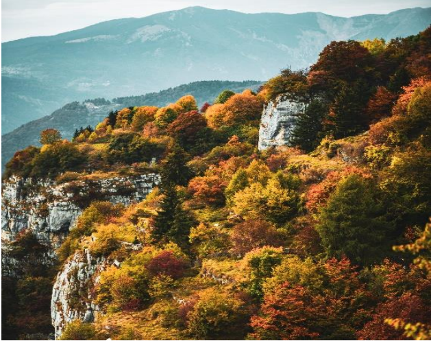
Forra del Lupo in Alpe Cimbra