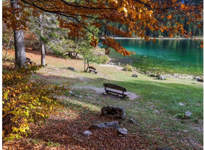
Lago di Tovel in Val di Non

Trento, 30. September 2020. Ein Spaziergang in den herbstlichen Wäldern wirkt sich positiv auf Emotionen aus und überrascht zudem mit neuen Licht- und Farbspielen während der Blick sich in der Vielfalt der hellen Farbtöne mit denen sich die Vegetation kleidet, verliert. Unter dem wolkenlosen und klaren Himmel der Herbstmonate bietet sich durch die warmen Farben ein wahres Schauspiel. Ein Spaziergang durch die frische Luft, umgeben von Laubwiesen, die je nach Zusammensetzung der Vegetation von Rot über Gelb bis zur Bernsteinfarbe leuchten. Outdoorfans und Fotografen stoßen auf eine authentische Umgebung und werden mit einem zauberhaften Panorama belohnt. Zu den besten Routen für dieses Erlebnis gehören folgende: