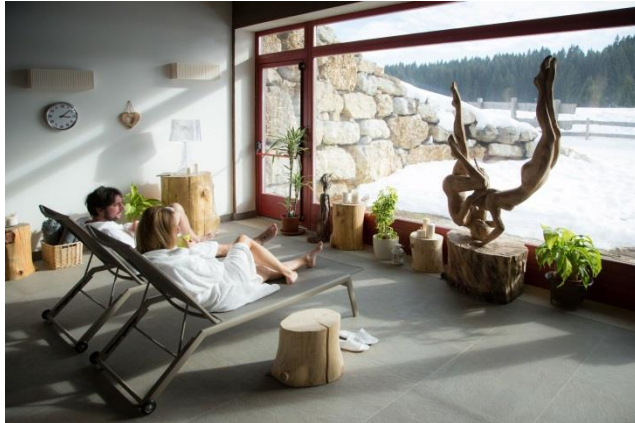
© Pillow Lab_Alpe Cimbra – Luserna – Millegrobbe - Malga