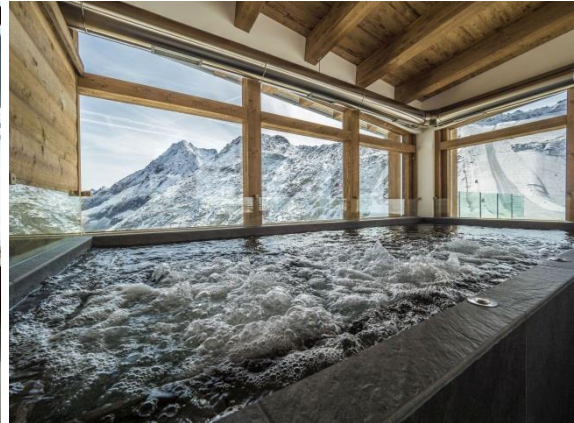
© Giampaolo Calzà_Val di Sole_Rifugio Capanna Presena

Trento, 23. Januar 2019. Im Trentino trifft alpine Naturverbundenheit auf italienische Dolce Vita . Hier ist Wellness weitaus mehr als nur eine vorübergehender Trend, sondern Teil der Lebensart. Für Erholungssuchende gibt es eine Vielfalt an Wohlfühl-Angeboten mit Stil und Qualität: vom Sprudelbad im Holzbottich über Beauty-Behandlungen mit Trentiner Äpfeln bis hin zu dampfenden Aufgüssen mit Blick aufs Alpenglühen.