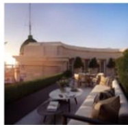
Nelson Suite Terrace