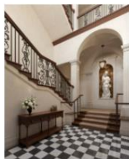
Residential Suites Entrance