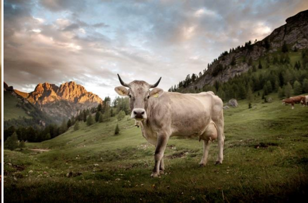
© Daniele Lira - Val Contrin

Trento, 21. Mai 2019. Von Food-Festivals über Käsepicknicks bis zum Dinner unter Sternen – für diejenigen die dem Geschmack der italienischen Dolomitenregion auf die Spur kommen möchten, gibt es im Sommer viele spannende Möglichkeiten.