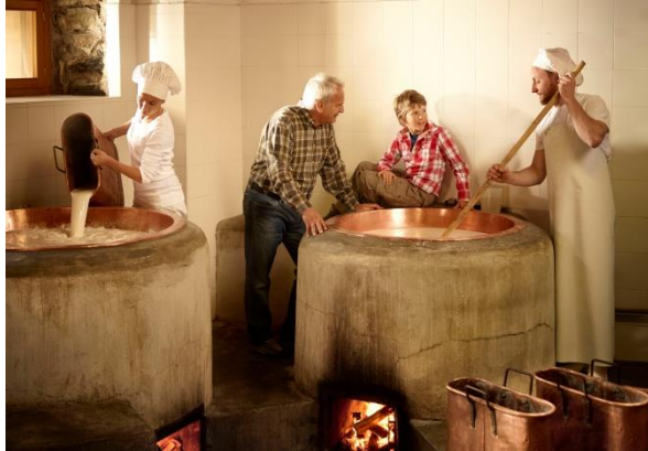
© Carlo Baroni - Val di Non - Malga Bordolona