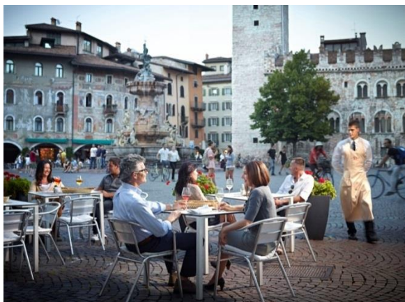
© Trentino Marketing_Carlo Baroni – Trento – Piazza Duomo

Mit neuer Flugverbindung von Hamburg, Berlin oder Köln in knapp zwei Stunden nach Verona