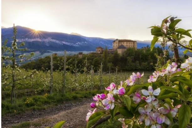
© Diego Marini - fioritura con castello