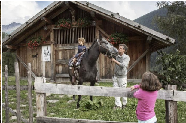
Val di Sole - Val di Pejo - Località Mezzoli - Baita 3 Larici

Trento, 13. März 2019. Als Familiendestination ist die Urlaubsregion Trentino voll auf die Bedürfnisse von Familien eingestellt: Zu einer großen Auswahl an attraktiven Familienhotels und Ferienwohnungen gesellen sich unzählige Freizeitmöglichkeiten – vom Besuch auf dem Schaubauernhof über Wanderungen zu verwunschenen Dörfern bis hin zur Schatzsuche in alten Burggemäuern. Gerade während der Osterferien lässt sich die Dolomitenregion nördlich des Gardasees wunderbar mit der ganzen Familie entdecken.