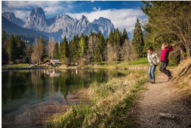
© Tommaso Prugnola - San Martino di Castrozza - Primiero - Vanoi – Lago Welsperg