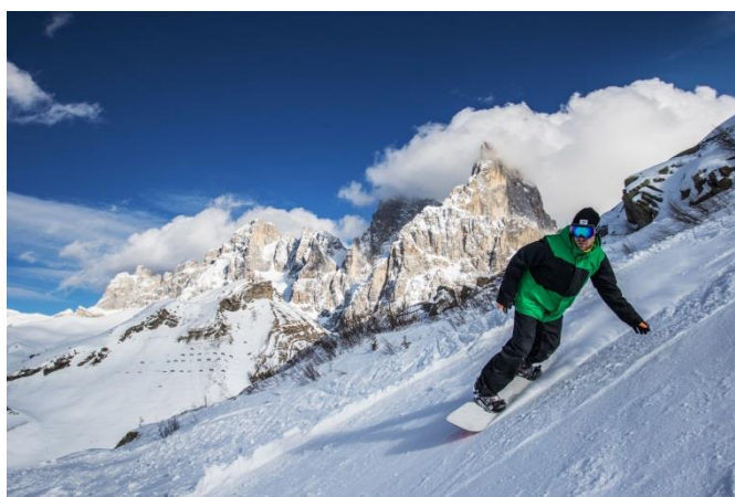
Snowboarder im Skigebiet San Martino/Passo Rolle

Trento, 16. November 2017. Gute Schneeverhältnisse sorgen in diesem Jahr für einen frühen Beginn der Wintersportsaison. Das erste Skigebiet des Trentino, Ghiacciaio Presena am Tonale Pass, hat seine Pisten bereits freigegeben. Am 18. November folgt die Saisonöffnung am Passo Rolle im Skigebiet von San Martino di Castrozza und am Grostè im Skigebiet von Madonna di Campiglio. Im Val di Fiemme, an der Paganella, am Passo San Pellegrino/Col Margherita und am Monte Bondone können sich Wintersportler ab dem 25. November die Ski anschnallen. Bis Anfang Dezember werden die Pisten überall im Trentino freigegeben. Hochkarätigen Ski-Events, wie dem 3-Tre Rennen, das auch in diesem Jahr im Trentino stattfindet, steht somit nichts im Weg.