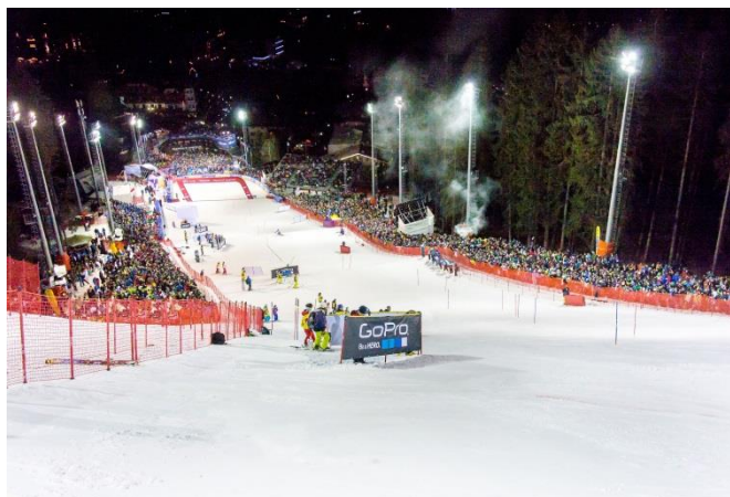
3-Tre Rennen, Canalone Miramonti, Madonna di Campiglio