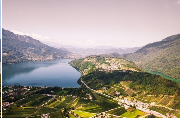
Laghi di Caldonazzo e Levico

Trento, 15. Januar 2019. Gleich zehn Hotels aus der Dolomitenregion Trentino wurden mit dem HolidayCheck Award ausgezeichnet. Vier davon zählen bereits das fünfte Jahr in Folge zu den beliebtesten Hotels der Region und erhielten den Gold Award. Mit Ausnahme des Hotels Cristallo und Parc Hotel du Lac, die Sport & Wellness Hotels in Levico im Valsugana sind die beliebtesten Hotels 2019 im Garda Trentino Gebiet angesiedelt. Auf der Basis von 950.000 veröffentlichten Gästebewertungen zwischen dem 1. Dezember 2017 und dem 30. November 2018, kürte das Hotelbewertungsportal in diesem Jahr bereits zum 14. Mal in Folge die beliebtesten Hotels weltweit. Die Kriterien für die Hotelauszeichnung beziehen sich unter anderem auf die Weiterempfehlungsrate und die Gesamtbewertung.