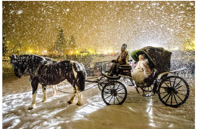
Habsburger Fasching

Trento, 30. Januar 2018. Der Februar steht im Trentino im Zeichen des Karnevals: Seit Jahrtausenden feiert ihn die Bergbevölkerung mit bizarren Masken und Kostümen sowie mit zahlreichen Umzügen, humoristischen Aufführungen, fröhlicher Musik und typischem Gebäck wie Grostoi und Frittelle. Noch heute halten lokale Kulturverbände die uralten Bräuche der Ortschaften lebendig, so auch im Val di Fassa, wo der Ladinische Fasching jährlich zu den spektakulärsten Veranstaltungen zählt. Im Val di Fiemme wird noch heute der Carneval delle Alpi mit einem großen Umzug gefeiert, während im Val di Cembra der Carneval di Grauno Besucher mit einem brennenden Baum anzieht. Ein Highlight im exklusiven Skigebiet Madonna di Campiglio ist der Habsburger Fasching, der an die Epoche von Prinzessin Sissi und Kaiser Franz-Josef erinnert.