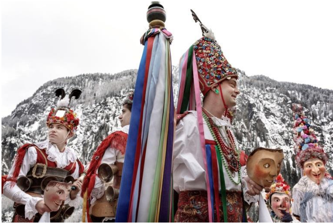
© Trentino Marketing, Daniele Lira, Ladinischer Fasching