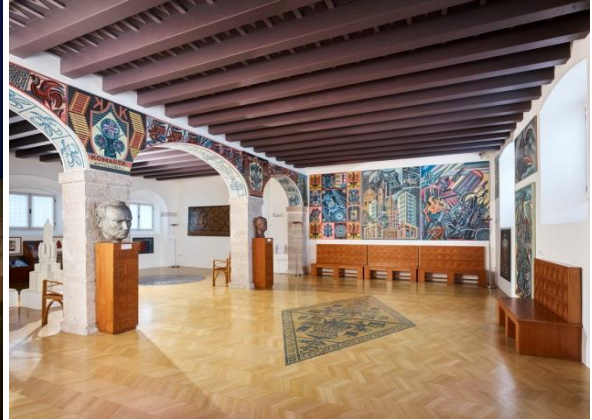
© Mart Archivio Fotografico e Mediateca Carlo Baroni - Casa Depero in Rovereto

Trento, 10. April 2019. Mehr als 250 Werke mit insgesamt zwölf verschiedenen Forschungslinien zur Malerei und Bildhauerei des zwanzigsten Jahrhunderts in Italien werden bis zum 8. September 2019 im Rahmen der Ausstellung Passione (Leidenschaft) im MART Museum für Kunstinteressierte zugänglich sein. Das Projekt ist der VAF-Stiftung, der größten, im MART gehüteten Kunstsammlung, gewidmet. Die Deutsche Stiftung zählt zu den bedeutendsten Sammlungen der Welt und ist aus der Leidenschaft für die italienische Kunst entstanden. Die Meisterwerke der größten modernen und zeitgenössischen Künstler werden abwechselnd sowohl den ersten Stock (25. Mai bis 8. September 2019) als auch den zweiten Stock (23. Februar bis zum 4. August 2019) des Museums belegen.