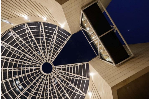
© Jacopo Salvi – Walking on Mart - Rovereto