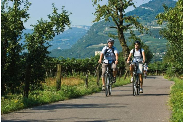
© R. Kiaulehn – Valle dell'Adige – Vallagarina