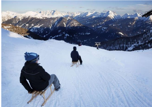
© Graziano Panfili_Val di Fiemme_ Pampeago - Passo Feudo – Slitte