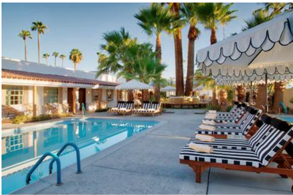
Klein, aber fein: Das Boutique-Hotel Dive Palms Springs verfügt lediglich über elf Zimmer und Suiten.

Dive Palms Springs eröffnet im November / Welwood Hotel von Gründergeist geprägt / Reservierungen für 2020 ab 1. November möglich