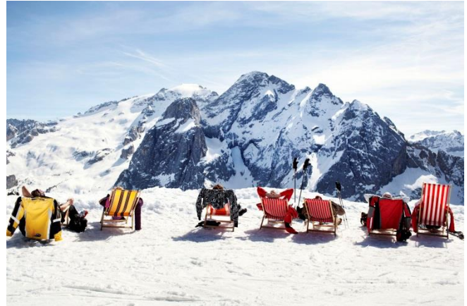
© Trentino Marketing, Pietro Masturzo, Val di Fassa

Trento, 28. Februar 2018. Auch im Frühjahr laden die Pisten des Trentino zum Skifahren und Snowboarden ein: Sonnenschein, beste Schneeverhältnisse und tolle Angebote wie das Trentino Ski Sunrise locken noch bis zum Saisonende in die Dolomiten. Zudem gilt die Zeit vor Ostern als ideal für Skitourengeher. In der norditalienischen Provinz genießen Wintersportler und Erholungssuchende im März bereits angenehm warme Temperaturen im Tal, finden Entspannung auf den vielen Sonnenterrassen, ziehen ihre Spuren im Pulverschnee und genießen das Dolce Vita.