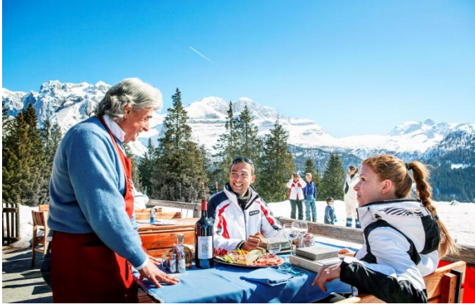
Madonna di Campiglio