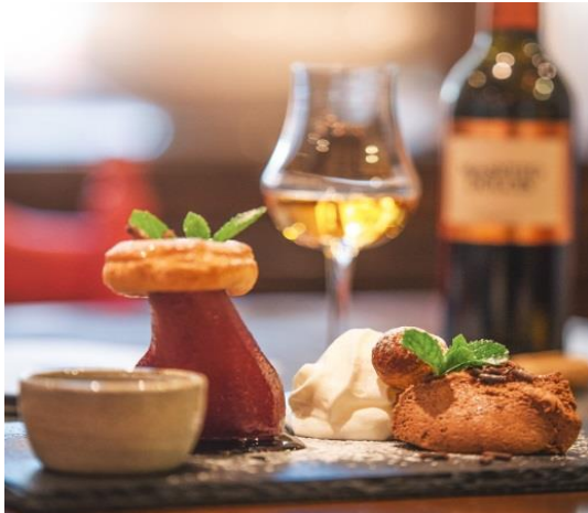
Eurochocolate Christmas 2018