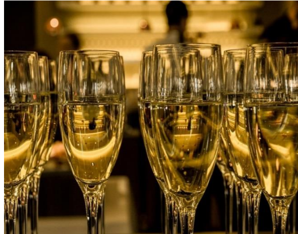
Garda con Gusto

Trento, 23. Oktober 2019. Im Trentino geht nichts ohne gutes Essen. Selbst auf der Skipiste, beim Schneeschuhwandern oder beim Weihnachtsshopping wird in der Dolomitenregion bisweilen ausgiebig geschlemmt. Und so gibt es für Aktivurlauber auch in diesem Winter wieder zahlreiche Gelegenheiten, um landschaftliche und lukullische Erlebnisse zu vereinen – manchmal auf ganz ungewöhnliche Weise.