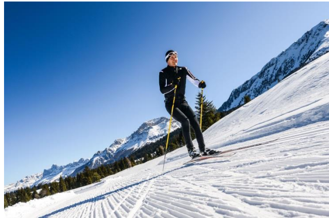
Skilangläufer im Val di Fiemme

Trento, 18. Januar 2018. Am 28. Januar 2018 ist es wieder soweit – Die besten Skilangläufer kommen beim traditionellen Marcialonga-Rennen im Val di Fassa und Val di Fiemme zusammen. Auch darüber hinaus hat das Trentino viel für Fans des nordischen Sports zu bieten: In den Skilanglaufgebieten der norditalienischen Provinz erwarten Urlauber gepflegte Loipen auf insgesamt 470 Kilometern Länge und mit der Fiemme-motion Wintercard oder dem Super Nordic Skipass vielseitige Angebot für den Anfänger bis zum Profi.