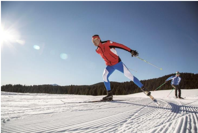
Skilangläufer im Skigebiet Alpe Cimbra