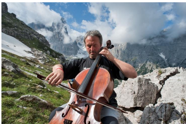
Val Rendena, Dolomiti di Brenta, Trekking Musicale

Bereits zum 24-ten Mal das Beste aus Musik und trentiner Bergwelt