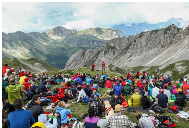
Val di Fassa, Gruppo Costabella

Trento, 22. März 2018. Vom 30. Juni bis zum 31. August 2018 ist es wieder soweit: Auf den Bergen und in den Tälern des Trentino erklingen beim Festival „Sounds of the Dolomites“ bereits zum 24-ten Mal imposante Freiluftkonzerte internationaler Musiker, Musikensembles und Bands. Beim diesjährigen Festival sind Musikgrößen aus so unterschiedlichen Genres wie Rock, Jazz, Klassik, aber auch Folk- und World-Musiker sowie Liedermacher vertreten. Dies alles vor der atemberaubenden Kulisse der Dolomiten mit ihren imposanten Felsen, verträumten Seen, malerischen Almwiesen und ursprünglichen Wäldern. Hier kann sich die Musik auf ganz besondere Art und Weise entfalten, so dass die insgesamt 25 Konzerte und Events sowohl für die Künstler als auch die Zuhörer zu einem unvergesslichen Erlebnis werden.