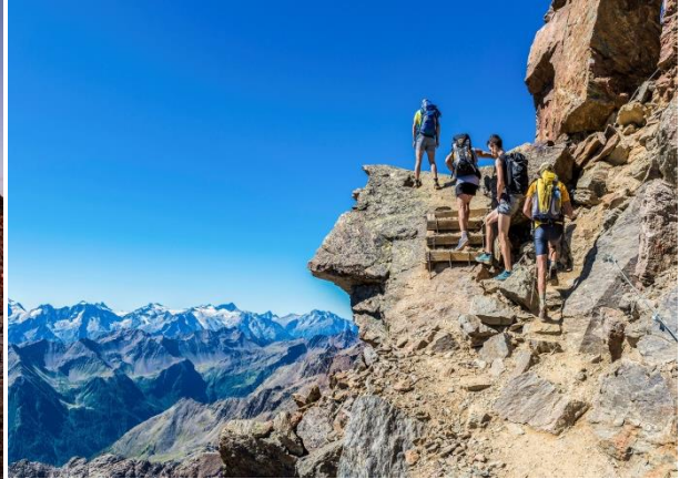
Trekking Rifugio Mantova al Vioz

Trento, 28. Mai 2019. „Im Frühtau zu Berge...“ – wer schon einmal in einem Rifugio im Trentino übernachtet hat und bei einem glühend-roten Sonnenaufgang losgewandert ist, der hat sie ganz sicher gespürt: die einzigartige Magie der Trentiner Bergwelt. Für diejenigen, die es noch nie erlebt haben gibt es ab dem 20. Juni mit der Saisonöffnung der Rifugi im Trentino wieder die Gelegenheit, diese einzigartige Erfahrung zu machen. Mit dem Weltnaturerbe Dolomiten und seinen malerischen voralpinen Landschaften ist das Trentino ein Paradies für Bergsportler und alle, die gerne Höhenluft schnuppern.