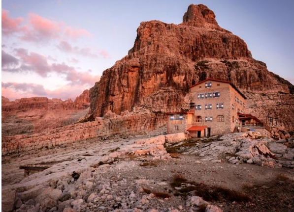
© Daniele Lira - Rifugio Tosa_Pedrotti Dolomiti di Brenta