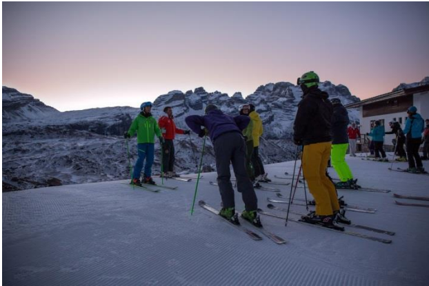
Trentino Ski Sunrise in Madonna di Campiglio