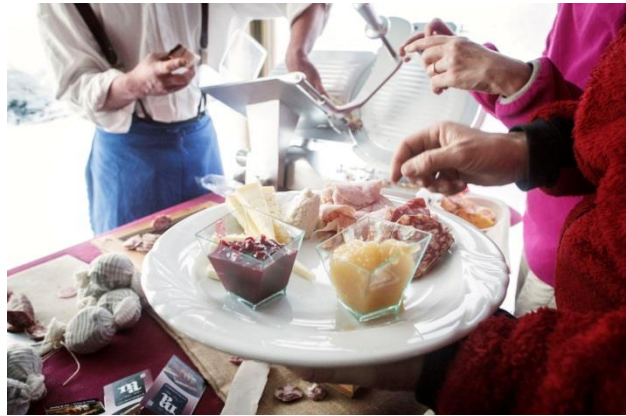
Frühstück vor der Abfahrt im Rifugio Ciampedie, Val di Fassa

Trento, 6. Dezember 2017. Mit der Veranstaltungsreihe Trentino Ski Sunrise können Skifahrer und Schneeschuhwanderer den Sonnenaufgang auf den frisch präparierten Pisten der trentiner Skigebiete erleben. Am 4. Januar 2018 beginnt die Ski Sunrise Saison im Val di Fassa und endet am 31. März 2018 mit einer letzten frühmorgendlichen Abfahrt im Val di Sole. Die geführten Touren sind in allen Skigebieten des Trentino buchbar und bieten den Teilnehmern ein unvergessliches Naturspektakel.